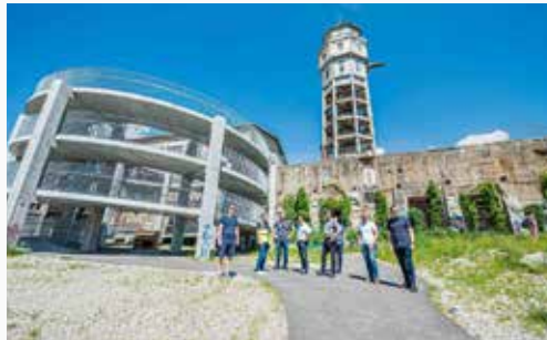
RONDELLE / AAREPLATZ