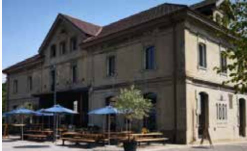
RESTAURANT KANTINE 1881